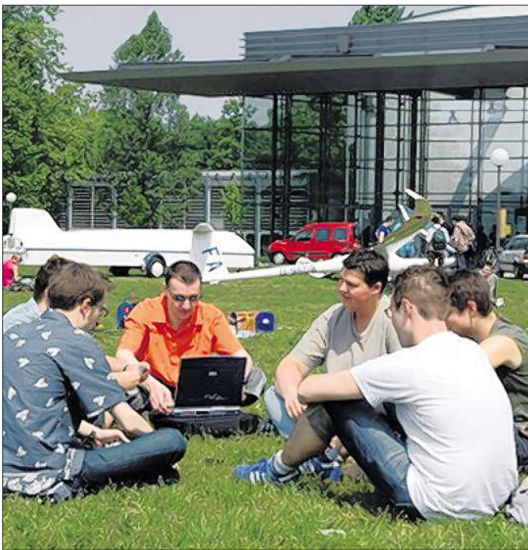
INFORMATIONSTECHNOLOGIE UND UNI: Mit IBM kommt einer der weltweit führenden IT-Anbieter auf den Campus und gründet mit der Fridericiana ein Institut für Dienstleistungsforschung.