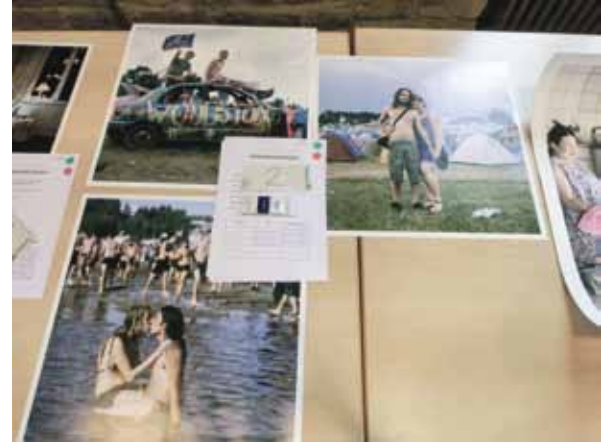
Die Punkte sind vergeben ...