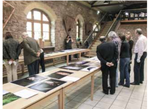
Der Verlauf der Jurysitzung wird fotografisch dokumentiert.