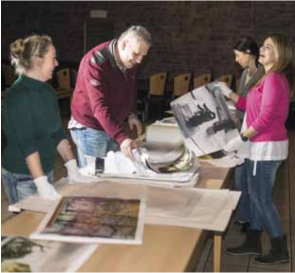
Das Fotowettbewerbs-Team beim Auslegen der Arbeiten am Vortag der Jurysitzung