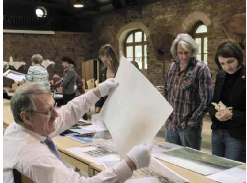
Auch die Bildlegenden werden bei der Beurteilung beachtet.