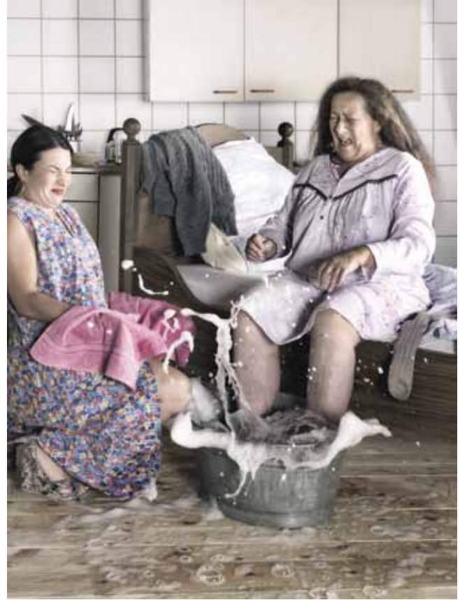
3. Preis Günther Egger | I'm just old I-III